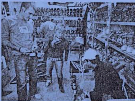
Alguns visitants, ahir, en el saló Nivalia.

La fira Nivalia concentra aquest cap de setmana els buscadors de gangues per la nova temporada d'esquí